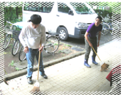
みんなで協力、そうじの時間です