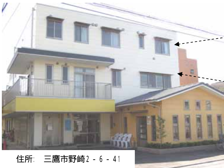
住所: 三鷹市野崎2 - 6 - 41

かねてよりお伝えしてきました、新しい事業所...障がいのある方が働く「工房 時(とき)」、高齢の方が通う「野ざきの家」。この二つの事業と、おおぞら会の法人本部が入る建物が完成しました！