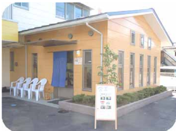
《自家製麺のうどん屋 おもむく食堂》