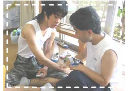
これからよろしく!

毎日現場にまぎれており、まったくオーラはないのですが、やはり皆さんにとって私は施設長であり、利用者からも「がんばって」と肩を叩かれ、ご家族からも成長を見守るような眼差しで温かく見ていただき、期待も日々実感しております。そして、その思いに応えられるよう自覚と責任をもって担っていきたいと思っております。