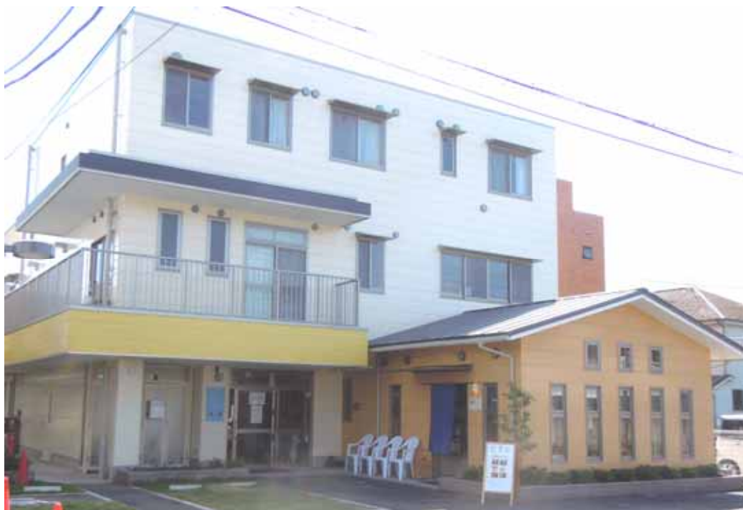
《野ざきの家 工房 時 外観》