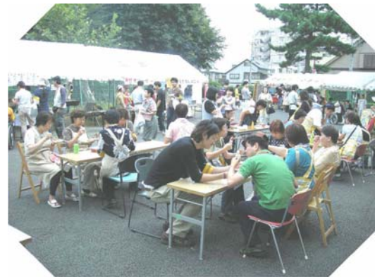
模擬店にもぎわいます

バザーは、単に資金集めという性質だけでなく、より多くの皆様に「おおぞら会」の活動を知っていただき地域にも還元できるものにしたという思いで、利用者・家族・職員も…おおぞら会に関わる人たちがひとつになって行なう行事として取り組んできました。毎年バザー当日は、昔からご協力を頂いているボランティアさん、ヘルパーさん、学生さんなどたくさんの方が応援団として参加してくださっています。また地域の企業や団体の方々からも協賛品や模擬店の出店を頂き、お客さんが喜んでくださるイベントとして盛り上げて頂いています。