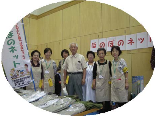
毎年参加の ほのぼのネットのみなさん