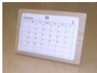
《かきこみカレンダー》