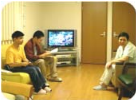
夕食後のだんらは大切な時間です

このような毎日の中、入居者の皆さんも徐々に生活ペースをつかみ、週末はガイドヘルパーと外出される方、実家に帰ってご家族と過ごされる方、時には外出せずにのんびり過ごす方などさまざまです。“それぞれが自分らしいペースで生活できるように”という思いが、少しずつ形になってきています。