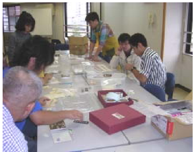
ラベル貼り...速さと正確さが求められる仕事です

市内の施設からそれぞれ寄り集まったの取り組みなので、参加者もスタッフもはじめて出会う人もいて、新鮮な気持ちで望んでいます。はばたけからの参加者2人も初日は緊張しながら出発しましたが、2回目には背筋をピンと張って「行ってきます」と凛々しく向かい、戻ってくると「他の作業所の人と話ができた。もっと仲良くなりたい。仕事のことを一緒に調べたい」「作業はむずかしけど、みんなしっかりやっています」などいきいきと話してくれます。