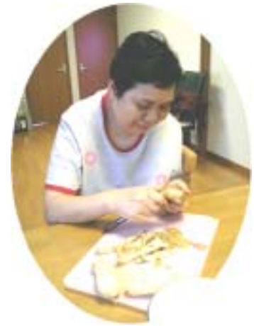
じゃがいもの皮むきはまかせて！

そして、スタート当初の忙しい時期を支えてくださった方々、宿直パートの学生の方々、ご家族の理解とご協力、地域の方々との交流、はばたけスタッフのバックアップと様々なサポートのもと、半年間を無事に過ごすことができました。ご近所の方もあたたかく見守ってくださっていて、朝出がけに、「あの人、布団干しががんばっているわね」「洗濯物、落ちそうだから気をつけて」など声をかけていただくこともあります。