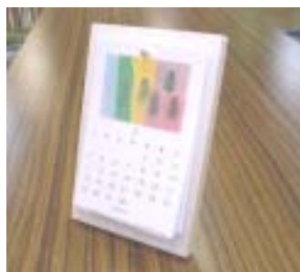
《てすきカレンダー》