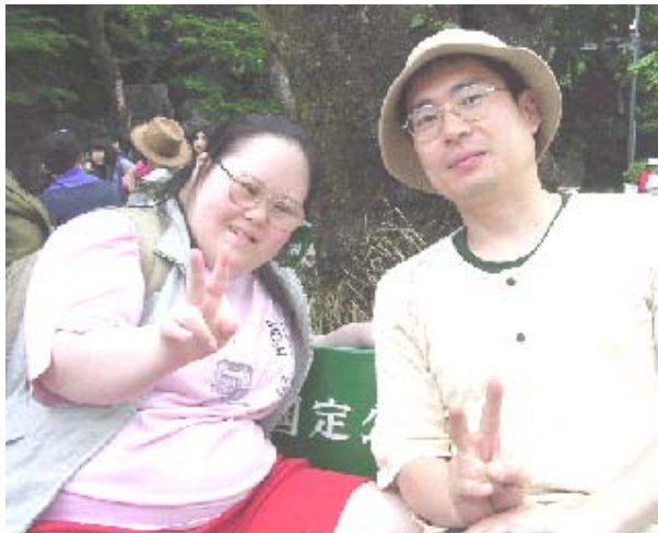
ゆっくりと、たくさんお話ができました...

ケーブルカーで登って、ゆったりとさる園やたこ杉を周遊するコース。緑ゆたかな道をのんびりと散策です。おいしい空気をめいっぱい吸い込んで、おかださんもにっこり。