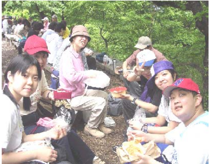
頂上で食べるお弁当は、やっぱりサイコーだね！

高尾山には、日本一の急こう配のケーブルカーがあり、手軽に山頂に行くこともできます。そのケーブルカーを楽しみにしている人も多く、はばたけでも1番人気のコース。山頂まで行けるか...と不安だった人も、みんなでワイワイ、意外と余裕で登れました。途中の薬王院の階段ではちょっと疲れたけれど...ね。