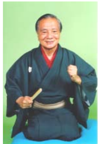
～古今亭圓菊師匠です！～

日時 7月17日(土) 13:30～ 場所 三鷹市公会堂大ホール 主催 三鷹市障害者福祉懇談会 出演 古今亭圓菊 金原亭伯楽 古今亭菊寿 伊藤夢葉 笑組 他