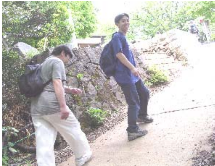
気合じゅうぶんです!